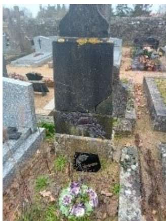
La section UNC de La BERNARDIERE

Alors qu'elle tombait en désuétude et en respect de la légalité, les Soldats de FRANCE de La BERNARDIERE ont décidés de procéder à sa restauration.